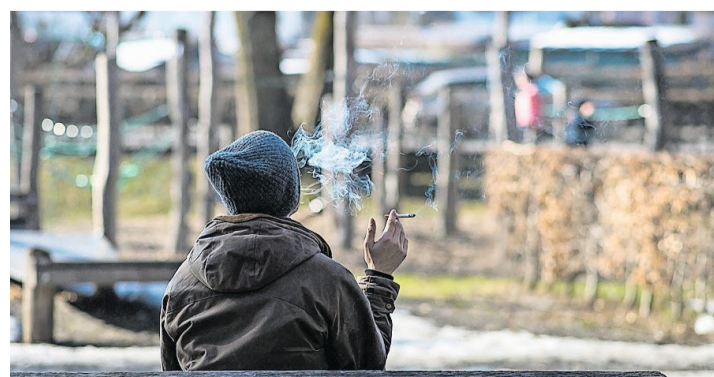
Bisher rief der Stadtrat dazu auf, auf Kinderspielplätzen freiwillig auf Rauchen zu verzichten.

Der Stadtrat teile die Einschätzung, dass Zigarettenstummel auf Kinderspielplätzen eine Ge-